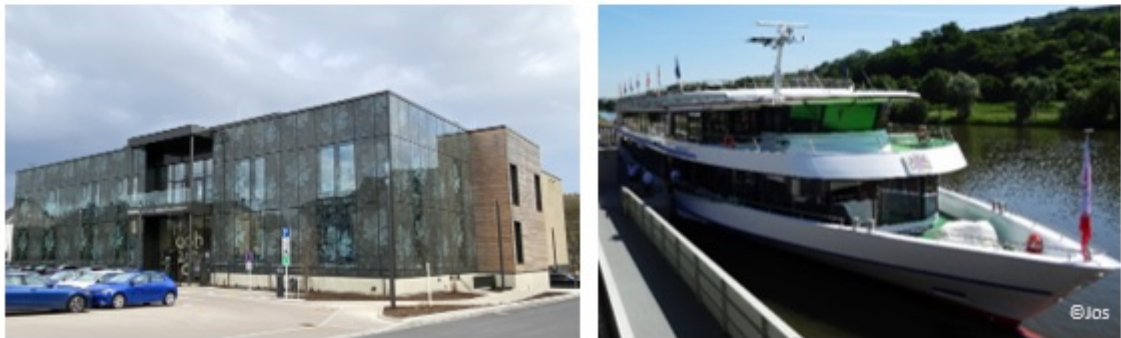
(Fotomontage: Jos. Soffiaturò)