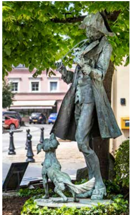
Dem Wil Lofy säi „Blannen Theis“ an der Foussgängerzon zu Gréiwemaacher.