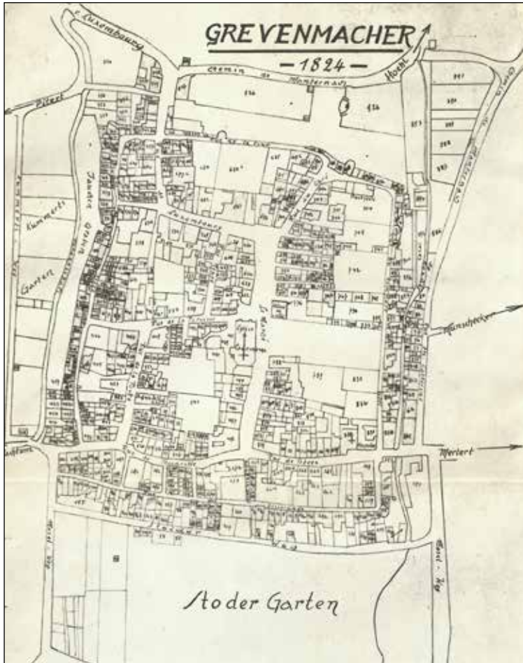
Den Urkadasterplang vun 1824, nogezeechent vum Jos. Hurt. (Gemengenarchiv Gréiwemaacher)

Vun der A(h)lkörrech iwwer d’Kofferschmattsgässel bis an den Zéilewee zesummegehallt am November 2022 vum Monique Hermes, Kulturschäffin