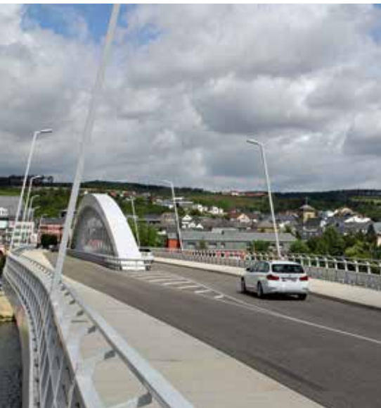
Déi nei Maacher Bréck verbënnt zënter Oktober 2013 d'Muselmetropol mat Wellen (D).

• Zënter 1882 huet Maacher eng „fest“ Muselbréck. Déi éischt Grenzbréck ass am September 1944 gesprengt ginn. Enn 1955 ass déi zweet Grenzbréck fir de Verkéier opgaang. Si stoung bis den 20. Mee 2013, wéi se ofgerappt ginn ass. De 15. Oktober 2013 war mat där eleganter nei-er Maacher Bréck erëm eng Verbindung iwver d'Musel do. Déi Bréck ass den 2. Juni 2014 vum Persouneschëff MS Princesse Marie-Astrid aus ageweit ginn.