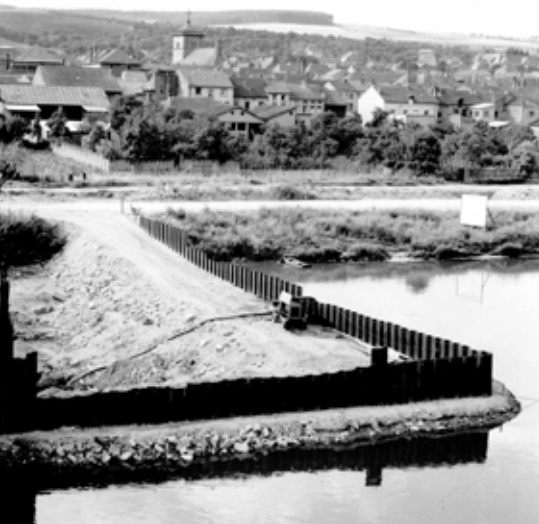
E Bléck op d'Stuedergäert an den 1960er Joren, wéi d'Schleis gebaut ginn ass.

tem Nachbar seit den Kindheitstagen besonders ans Herz gewachsen ist, aber er scheint mir doch die Ehre beanspruchen zu können, das originellste Straßengebilde aus Alt-Grevenmacher zu sein. (...) Die eine Häuserfront, jedenfalls die älteste, ist auf dem früheren Festungsgraben aufgebaut. (...) Der „Stu'ed“ oder Staden lief am Stadgraben vorbei, und erst als vor etwa dreimal hundert Jahren (Anm.: 1688) das mittelalterliche Bollwerk in den Haufen gerannt wurde, da begannen die Siedlungen der Menschen in diesem Viertel. (...) Noch heute sieht man über zwei alten Haustüren das Wappenzeichen der Schiffsleute eingemeißelt, ein mit dem Strick umwundener Anker und zwei gekreuzte Ruder. Jahreszahl 1793, wenn auf mein Gedächtnis Verlass ist. (...)