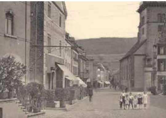
D'Groussgaass op enger Postkaart vu fréier. (Gemengenarchiv Gréiwemaacher)