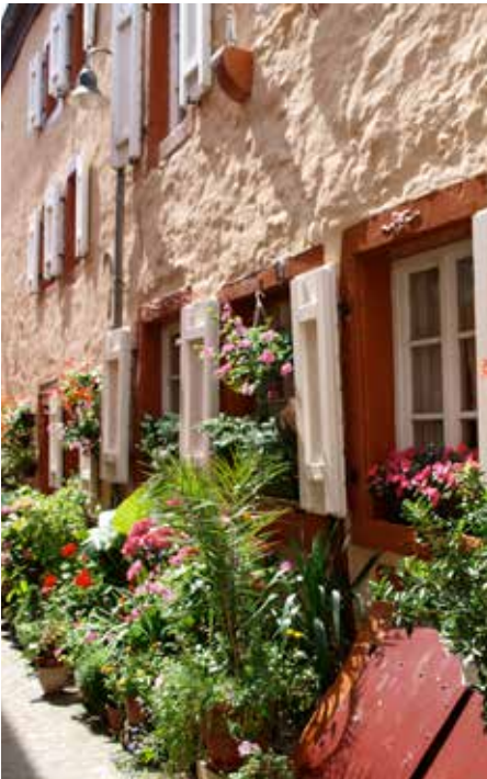
D’Kofferschmattsgässel: Eng pittoresk Gaass am Häerz vu Gréiwemaacher.

D’Kofferschmattsgässel, eng vun deene véier Gaassen am Häerz vu Maacher, erreecht ee vun der ieweschter Groussgaass aus. Iwwer eng Trap hannen an der Gaass kënnst ee weider an d’Schaackegässel.