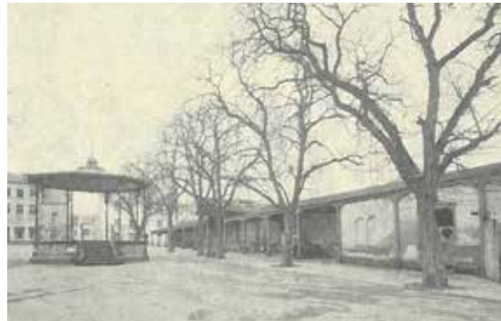
D'Maartplaz mat Kiosk an „Diegelchen“.