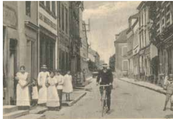
Eng Stroossenzeen am Joer 1922 an der Tréiererstrooss.

• Um Festungsplang heescht d'Strooss Triergasse, an d'Trierthor ass agezeechent. Um Plang vun 1824 ass et d'rue de Trèves, an den Anton Wagner (1) nennt se Trierische Straße.