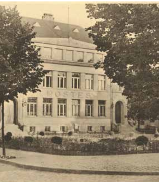
D’Schiltzeplaz mat der Post am Joer 1940.