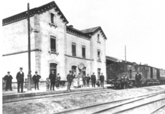
D'rue de la Gare erënnert un déi Maacher Gare – hei am Joer 1910.