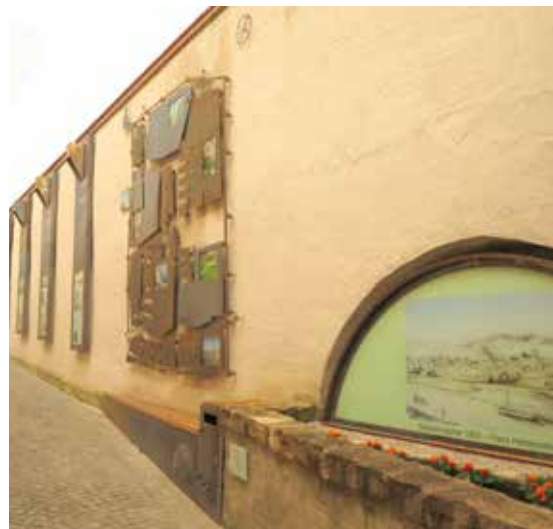
An der Fräilichtgalerie Turgaass kann ee sech iwwer d’Maacher Geschicht informéieren.